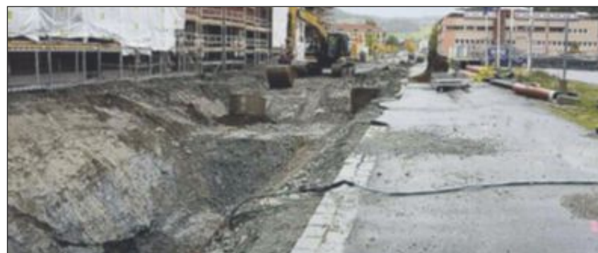
GRAVES OPP: Oppgravinga av miljøgata har startet.