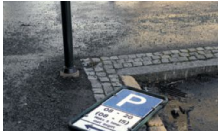
Mister p-plasser: Midtbyen blir stadig trangere for dem som er avhengig av bil. 242 p-plasser er blitt borte siden 2007.