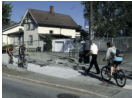
Forsinket: I lla er sykkelanlegget forsinket.