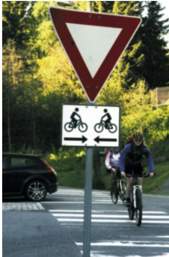
Vikeplikt for hvem? Er det en skøyer som har snudd skiltet?