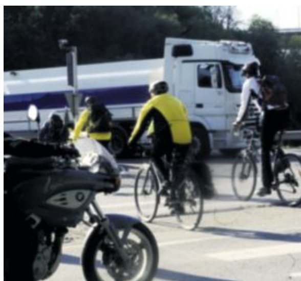
Sluppen: En daglig kamp for å komme seg over på noen sekunder med grønn mann.

Det besværlige valget er ditt: Fortsetter du som syklende bil eller fotgjenger på to hjul?