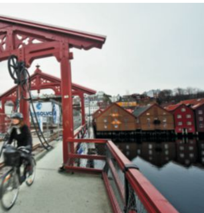
Klar: Gamle Bybro er snart ferdig reparert. Nå skal politikerne avgjøre om bilene igjen skal innta brua.