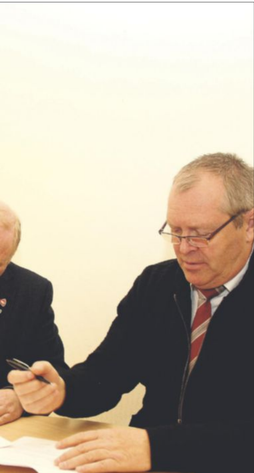
Midtre Gauldal kommune signerte avtalen som sikrer Midtre Gauldal fullt eierskap i Gauldal.