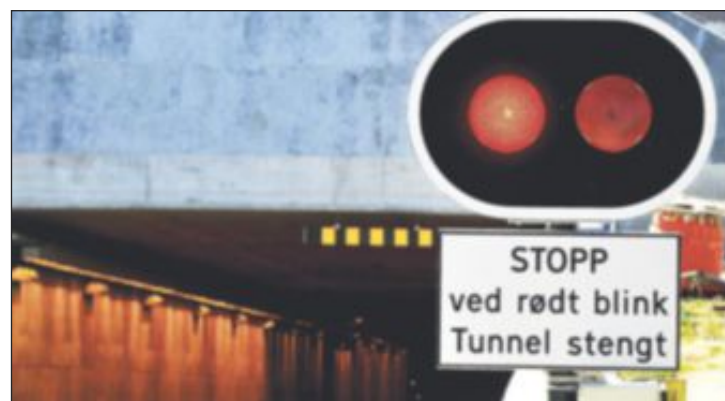
STENGES: Alle de fire tunnelene mellom Trondheim og Værnes kommer til å være stengt i perioder ut året.

I Væretunnelen monteres ekstra ventilasjon og all belysning skal skiftes ut i Stavsjø-